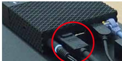
シンククライアント(一例) DisplayPort

※挿し替えて表示する場合は PC / シンククライアントの故障ですので正常な機器を接続してご使用ください。 表示しない場合はケーブルまたは配信機器の故障の可能性あります。